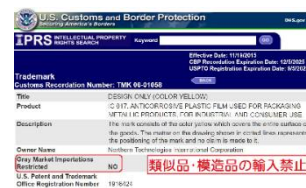
合衆国税関・国境警備局登録