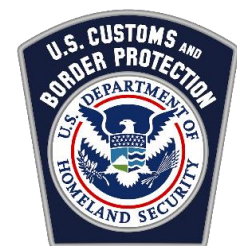
合衆国税関・国境警備局